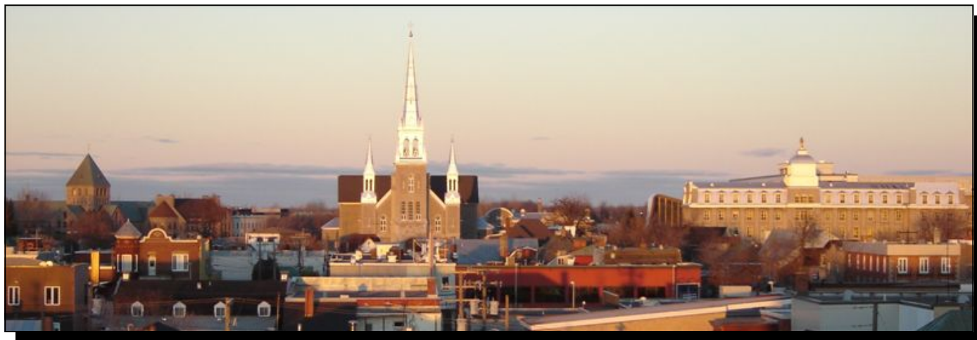
MRC de Joliette

À la condition d'en mentionner la source, la reproduction de ce document à des fins non commerciales est autorisée.