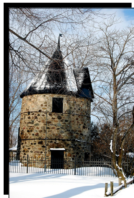
MRC de L'Assomption